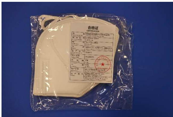
Verpackung / Packaging