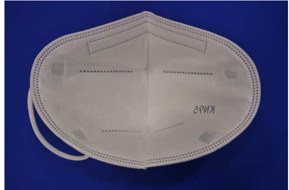
Innenansicht / Inner view