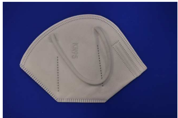
Seitenansicht / Side view