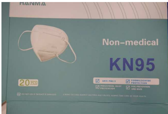
Umverpackung Vorderseite / Outer packaging front

Die folgende Maske wurde geprüft / The following mask was tested: