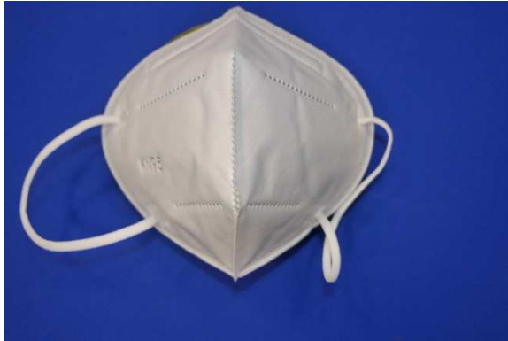
Frontalansicht / Frontal view