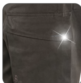
boční kapsa side pocket boczna kieszeń