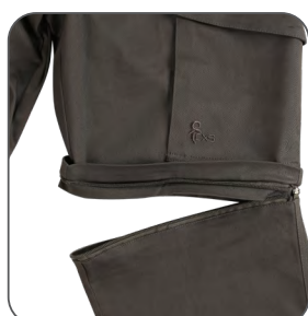
odepínací nohavice detachable legs odpinane nogawki